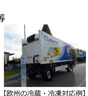
【欧州の冷蔵・冷凍対応例】