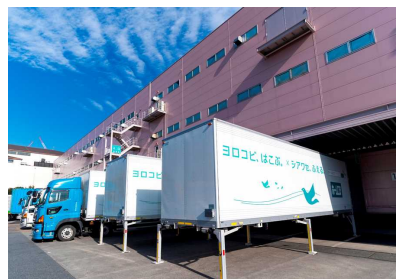
【スワップボディコンテナ車両】